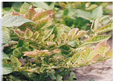
Síntoma de punta morada

Bactericera cockerelli está asociada con la transmisión de la enfermedad conocida como punta morada en papa y tomate, cuyo agente causal es un fitoplasma. En el cultivo de la papa se le relaciona con la bacteria Candidatus liberibacter , que afecta el rendimiento del tubérculo, se le conoce como zebra chip.