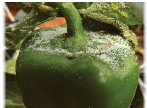
Daño directo del insecto

El insecto posee tres etapas de desarrollo: huevo, ninfa y adulto. En las dos últimas es cuando causa el daño. La ninfa tiene la capacidad de inyectar una toxina en la planta, al momento de alimentarse, lo cual provoca trastornos fisiológicos que afectan el desarrollo y rendimiento de la misma así como la calidad en la producción. Los síntomas del daño pueden confundir a los expertos pues son similares a los que causan otros organismos patogénicos.