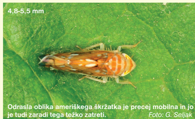
Odrasla oblika ameriškega škržatka je precej mobilna in jo je tudi zaradi tega težko zatreti.

OU Maribor: 02 238 00 00, OU Murska Sobota: 02 521 43 40, OU Ptuj: 02 798 03 60, OU Celje: 03 425 27 70, OU Postojna: 05 721 15 50.