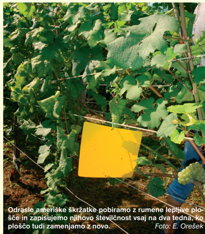
Odrasle ameriške škržatke pobiramo z rumene lepljive plošče in zapisujemo njihovo številčnost vsaj na dva tedna, ko ploščo tudi zamenjamo z novo.

Konec junija, ko se pričenejo izlegati odrasli škržatki, v vinograde nastavimo rumene lepljive plošče. V uporabi so standardne rumene plošče (Unichem, Biotech, Rebel ali Terminator).