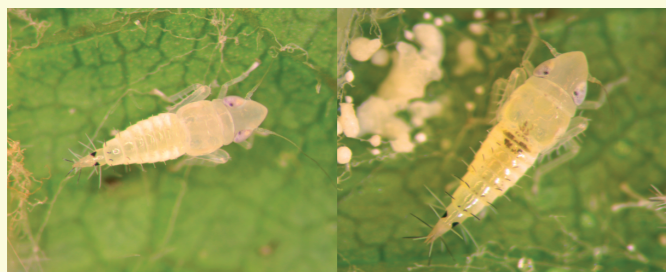
Ameriški škržatek v najprimernejši fazi razvoja za zatiranje: kot ličinka (slika levo - L 2 ) in nimfa (slika desno - L 3 )

Ameriški škržatek ( Scaphoideus titanus Ball) je v naravi glavni žuželčji prenašalec karantenske bolezni trte - zlate trsne rumenice, ki jo povzroča fitoplazma Grapevine flavescence dorée (FD) s sistemsko okužbo trte ( Vitis L.). Fitoplazmo FD prenaša na perzistenten način (kužen ostane celo življenjsko dobo) s trte na trto. Zlata trsna rumenica povzroča veliko gospodarsko škodo zlasti pri pridelavi grozdja. Ameriški škržatek živi predvsem na trti, hrani se z rastlinskim sokom in razvije en rod na leto. Meri od 4.8 do 5.5 mm.