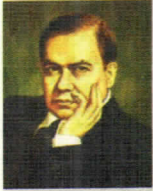
Rubén Darío (1867-1916)

QUE EL REGISTRO DE MARCA DE FÁBRICA Y COMERCIO: