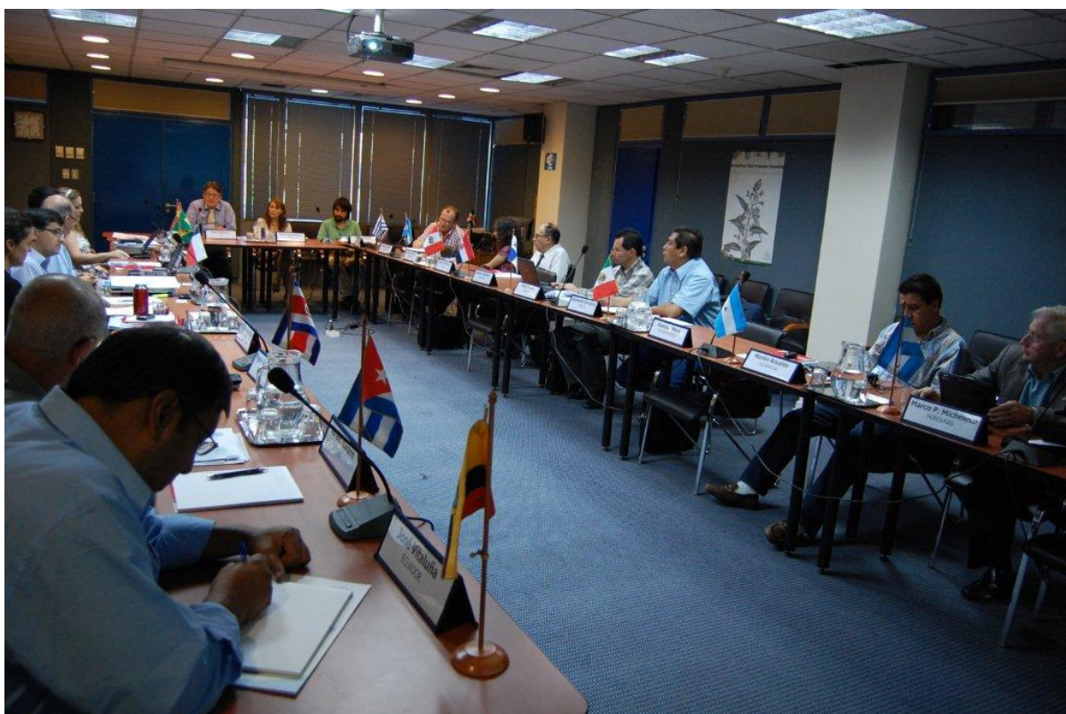
Fotografía 2: Acto Inaugural