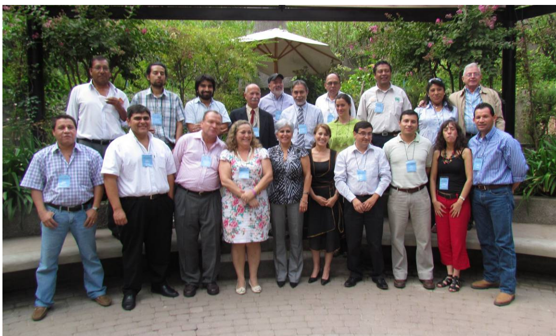
Fotografía 4: Participantes del taller