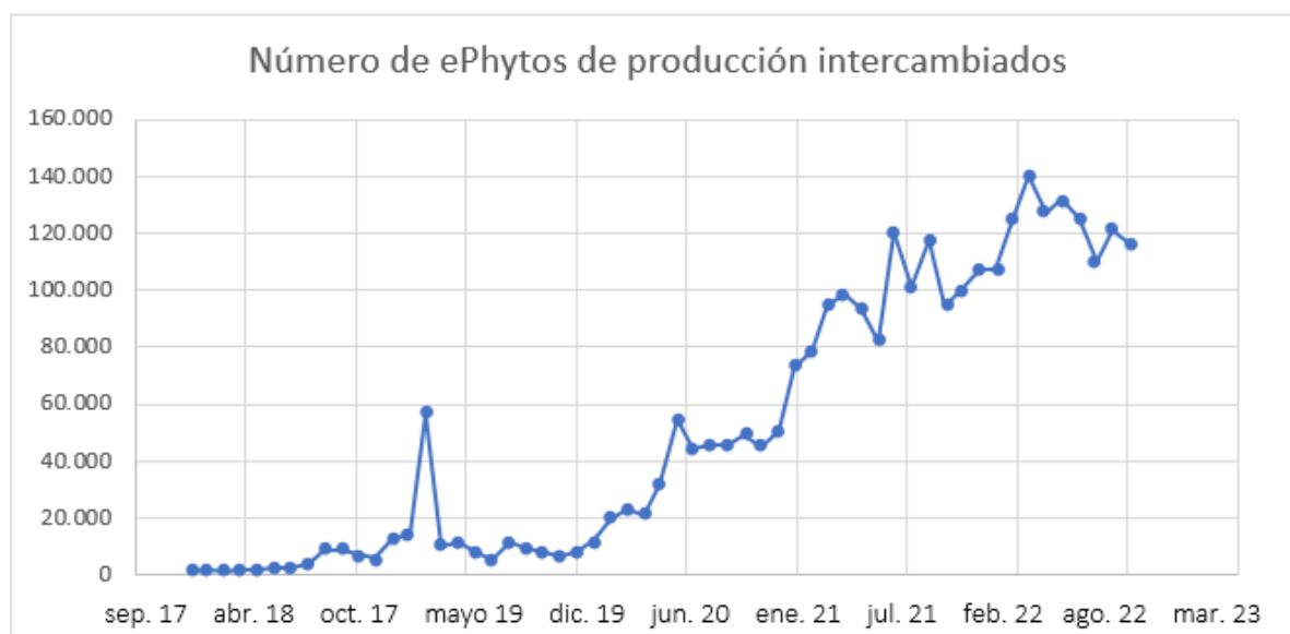
Figura 1: Intercambio mensual de ePhytos (septiembre de 2017 a septiembre de 2022)