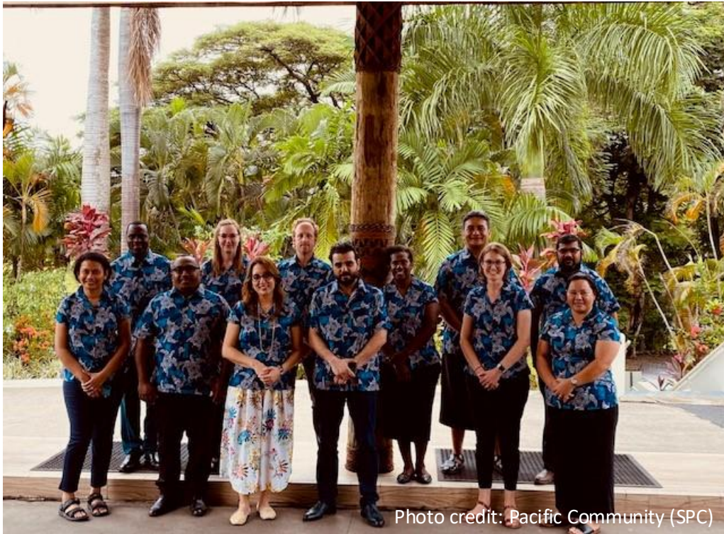
Groupe de réflexion sur « l'aide sûre » lors de sa réunion en présentiel à Nadi, Fidji, 2023,