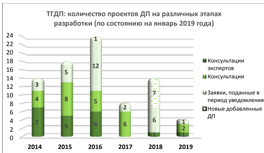
Рис. 1. Разработка диагностических протоколов (ДП) Технической группой экспертов по разработке диагностических протоколов (ТГДП) МККЗР и планы на 2019 год