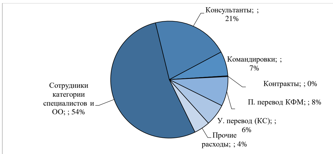
Рис. 2. Расходование средств в 2022 году по Регулярной программе ФАО с разбивкой по видам расходов (долл. США)

[10] Общая сумма израсходованных Секретариатом МККЗР средств, ассигнованных по Регулярной программе ФАО, составила в 2022 году 3 309 136 долл. США.