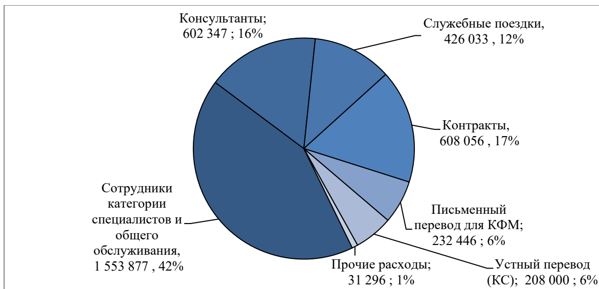
Рисунок 2. Расходование средств в 2023 году по Регулярной программе ФАО с разбивкой по видам расходов (долл. США)

[10] Из общей суммы расходов по РП ФАО за 2023 год (3 662 055 долл. США) 2 156 224 долл. США было израсходовано на персонал (сотрудники категории специалистов и общего обслуживания и консультанты), 426 033 долл. США – на служебные поездки, 1 048 502 долл. США составили расходы по контрактам и расходы на письменный и устный перевод, 31 296 долл. США – прочие расходы. Во исполнение рекомендаций Финансового комитета (ФК) в таблице 2 отражена подробная детализация расходования средств бюджета РП ФАО по видам расходов.