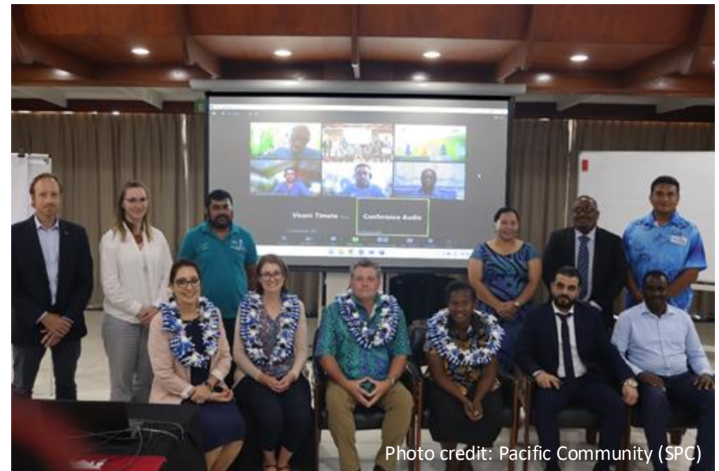
Целевая группа КФМ по « безопасности оказания помощи» на очном заседании в г. Нади, Фиджи, 2023 г.