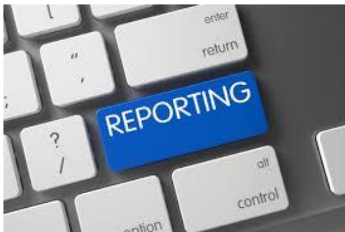
Наличие систем оповещения