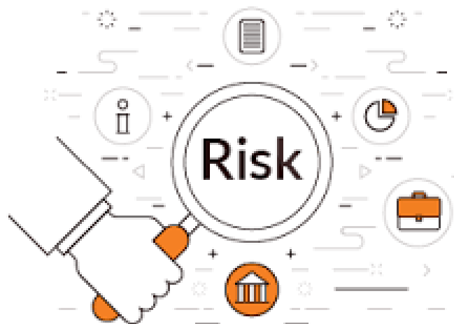
Составление профиля риска