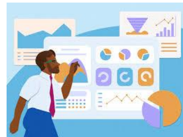
Проведение анализа данных